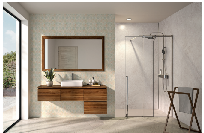
Kinewall Design décors Exotic (partie gauche) et Marbre nebbia (douche).