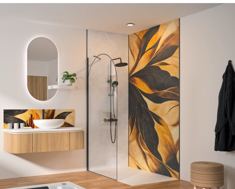
Nouveaux décors 2026 de Kinewall Design : Royal folia et Marbre nebbia