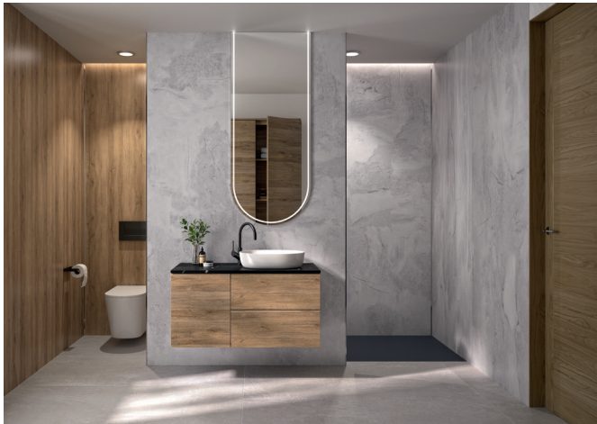
Nouveauté 2026, le décor Grey stone Kinewall Design