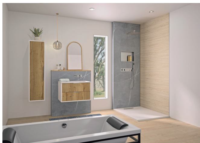
INTEGRA DESIGN en deux décors : Marbre gris et Galet.