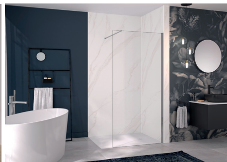
INTEGRA ESSENTIEL+ décor Marbre mordoré.

- INTEGRA DESIGN (panneau de fond en 3 décors possibles*, mitigeur thermostatique, barre de douche, douchette à main, étagère, flexibles d'alimentation - hauteur de 250 cm) ;