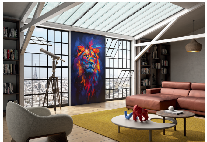
Le pouvoir esthétique Kinewall Design peut aussi sortir de la salle de bains pour habiller les autres pièces.

Prix public indicatif à partir de 306 euros HT le panneau de 202 x 100 cm.