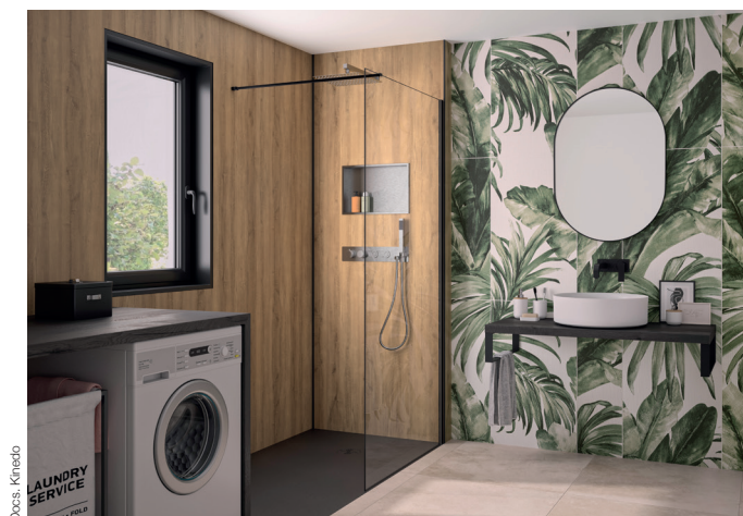
INTEGRA PREMIUM Chêne antique et sa niche de rangement intégrée.

- INTEGRA PREMIUM (panneau de fond en 3 décors possibles*, mitigeur thermostatique encastré avec boutons poussoirs, douchette à main, douche pluie, niche de rangement, le tout en inox brossé, flexibles d'alimentation - hauteur de 250 cm).