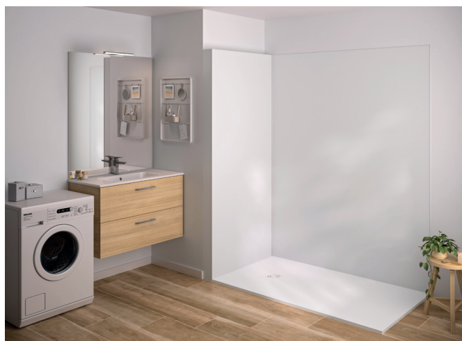
Ci-dessus, INTEGRA Essentiel.