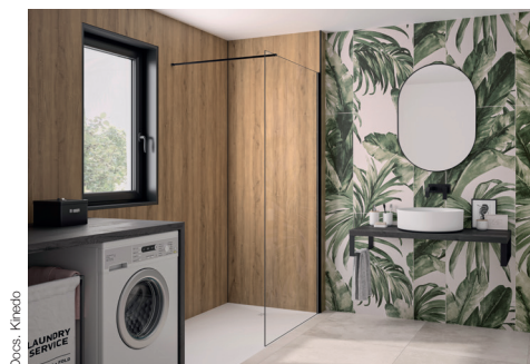
INTEGRA ESSENTIEL+ en décor Chêne antique.

Prix public indicatif à partir de 826 euros HT hors pose INTEGRA ESSENTIEL.