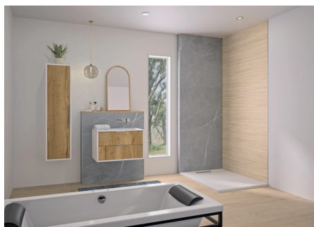
INTEGRA ESSENTIEL+ décor Marbre gris galet