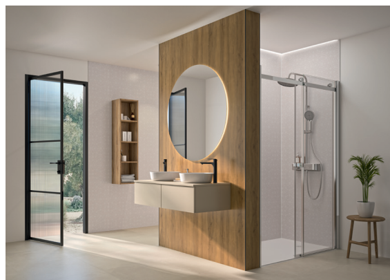
Kinewall Design décors Mandala sur les murs de la douche et mur du fond ainsi qu'un décor Chêne antique pour la partie lavabos.

Kinewall Design est d'ailleurs éligible à MaPrimAdapt. Côté déco, les panneaux Kinewall Design se déclinent à l'envi en décors unis, à motifs ou encore à texture. Parfaits de réalisme, ils déclinent des palettes décoratives de divers influences : Nature/Zen, Industriel, Maison de famille, Moderne, Bohème/exotique ou encore Chic. Ils s'inspirent de matériaux naturels comme le bois (chêne antique), de finitions minérales (marbre, pierre...), jouent aussi la carte des matières (tadelakt, ciment, acier...) comme du végétal (palmier, cactus, jungle...) et peuvent imiter à merveille le carrelage et ses joints (faïence, tomette...).