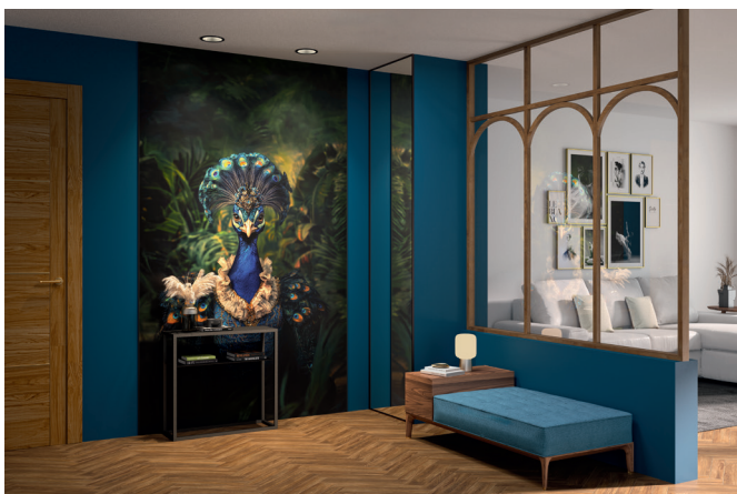
Kinewall Design décor Paonara, une nouveauté 2026 qui réhausse et habille cette entrée.