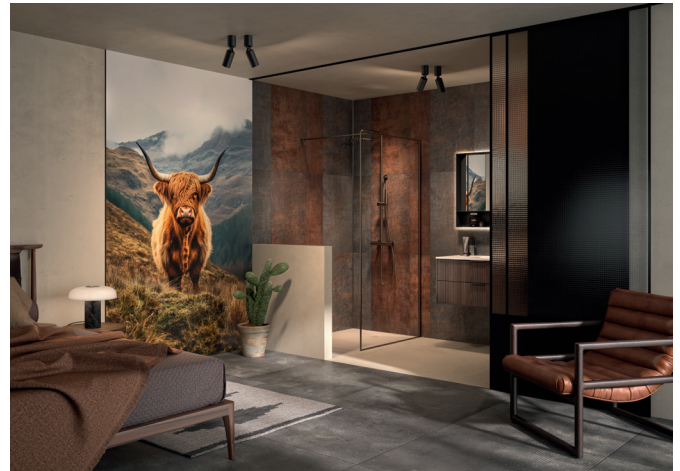
Kinewall Design offre la possibilité à l'envi de mixer les décors, comme ici, la nouveauté 2026 Highland à gauche et Métal stone pour la partie douche.

La collection 2026, riche de 73 décors, est marquée par l'arrivée de nouvelles références, au rang desquelles : Nuit fauve, Tangram, Paonara, Botanic terrazzo, Collines, Mandala, Métal stone, Highland, Grey stone, Royal folia, Piega oliva, Piega, Sporalis, Sporalis vert, Exotic ou encore Marbre nebbia.