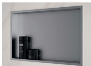
Zoom sur la niche de rangement INTEGRA Premium

* marbre gris galet, marbre mordoré et chêne antique.